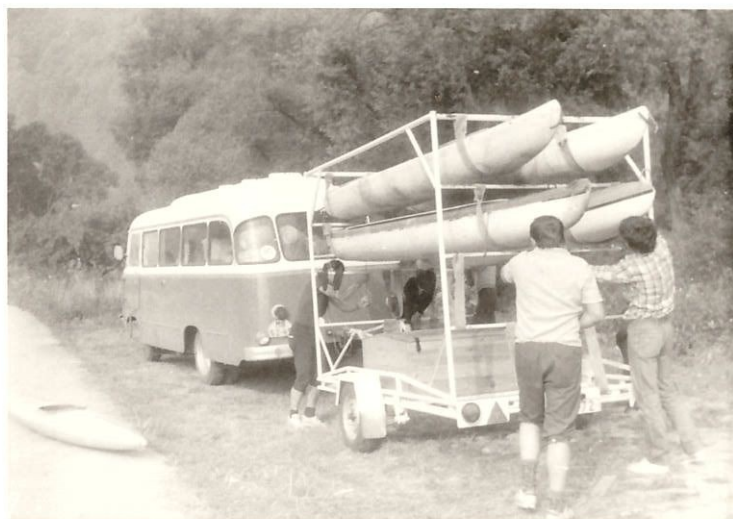
První výjezdy naším Roburem