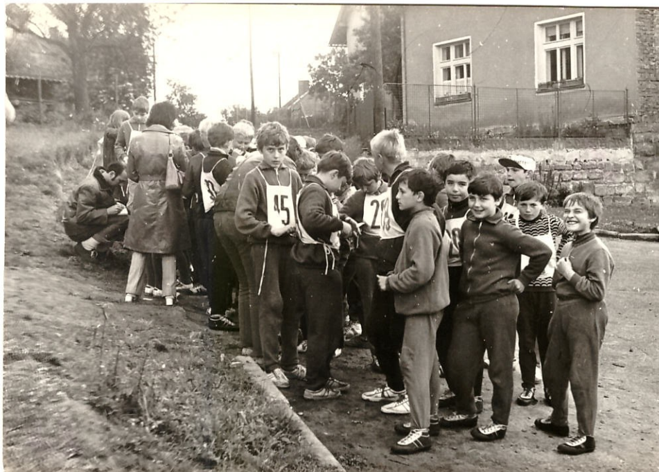
Branné závody na Olšíně