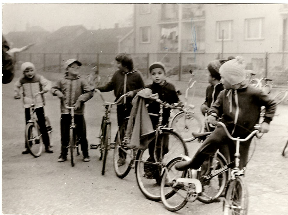
Cyklistické závody pro děti 80.léta