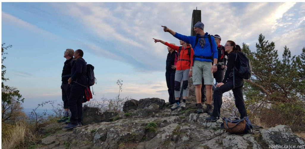
6.10.2018 - Pochod Přes tři vrcholy Českého ráje