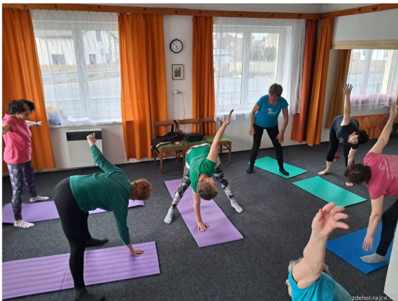
2025 - Pravidelná cvičení žen

Mimoto se se několikrát uskutečnil kurs sebeobrany, několik brigád na pomoc obci a bez přestávky probíhají pravidelná cvičení žen.