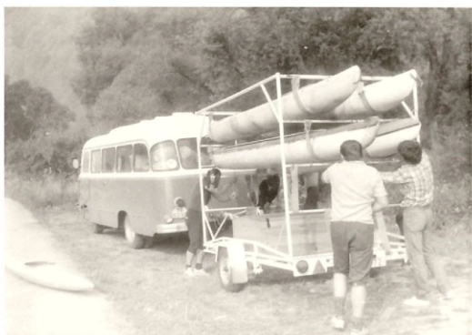
První výjezdy naším Roburem