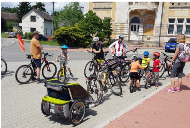
7.6. 2020 - Cyklovýlet pro děti