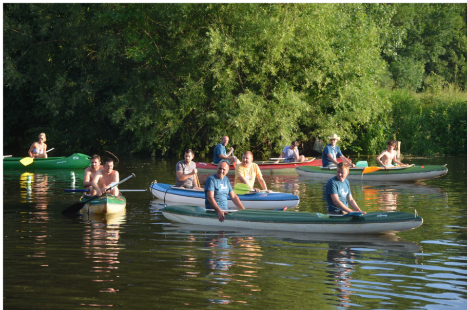
24.6.2017 – Otevřená loděnice